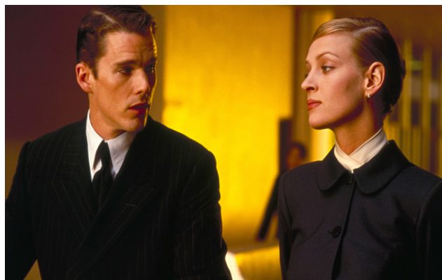
People will talk , J. - L. Mankiewicz, USA, 1951 ; Titicut follies , F. Wiseman, USA, 1967 ; Gattaca , A. Niccols, USA, 1997.